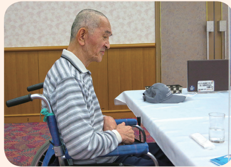
まだかな〜♪と 思わず顔がほころびます(´ω`)