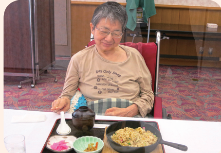
鉄板はとっても熱いのでお気を付けて！！