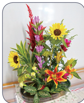
9月の生け花クラブ作品