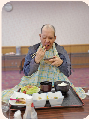
大きな口でパクリ！ お味はいかがですか？