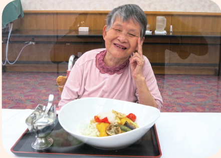
満面の笑みでピース！ いただきまーす(*!▽*)