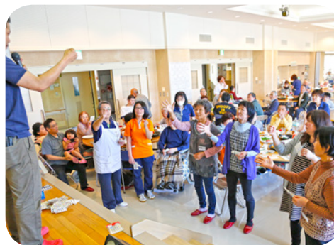
最後の景品はじゃんけんで。