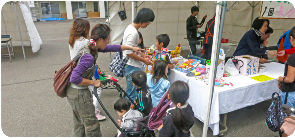
子ども達に大人気のゲームコーナー

ゲームコーナーは屋外で開催。肌寒い日にもかかわらず、たくさんの子も賑わいました。