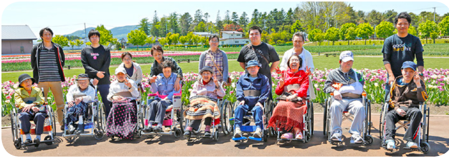
天候にも恵まれ大満足！